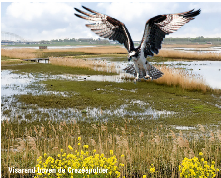
Visarend boven de Crezéepolder

Met een bijdrage van Ladies' Circle 40 Voorne kochten we vier jonge Galloway runderen aan. Deze jonge ossen, opgegroeid bij het Limburgs Landschap, voelden zich meteen thuis in de Duinen van Oostvoorne. Hiermee is de kudde met tien dieren weer op sterkte. Langzaam nemen we afscheid van onze oudere dieren, sommige zijn inmiddels zo'n vijftien jaar.