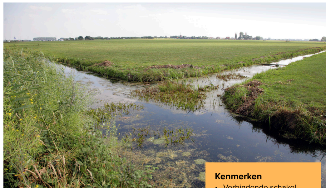
De Elfenbaan bij Hazerswoude is een mooi voorbeeld van een ecologische verbindingzone in agrarisch gebied.

Naar verwachting zullen deze inspanningen uiteindelijk zichtbaar worden in het landschap. Dit komen we te weten door eigen metingen maar dus ook dankzij bijdragen van inwoners via het citizen science programma Vang de Watermonsters.