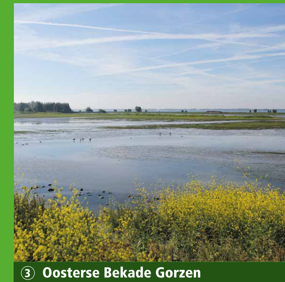
3 Oosterse Bekade Gorzen