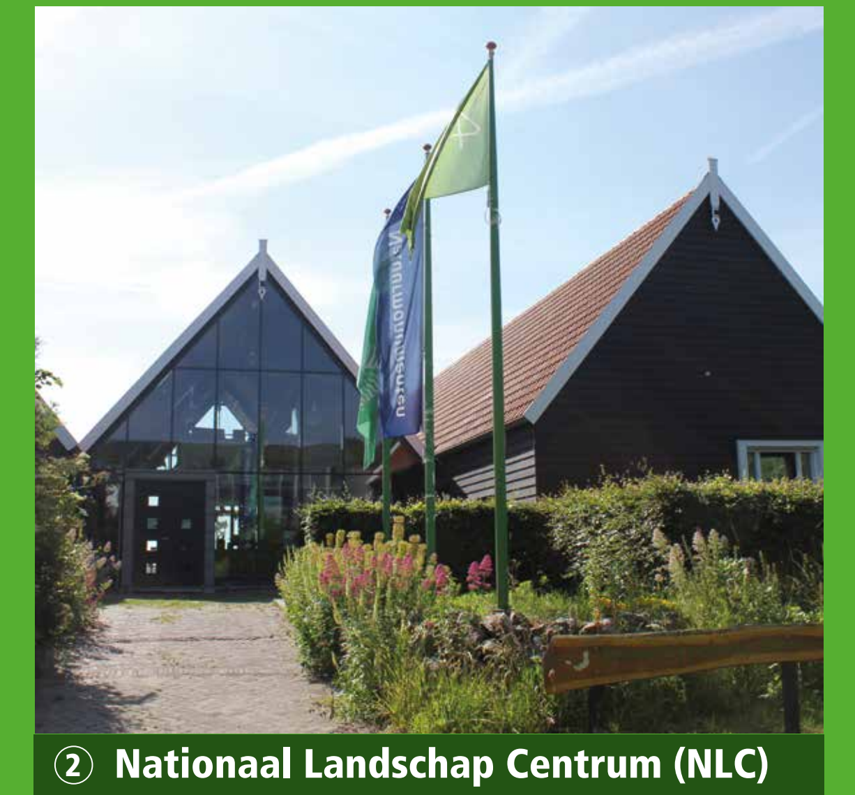
2 Nationaal Landschap Centrum (NLC)