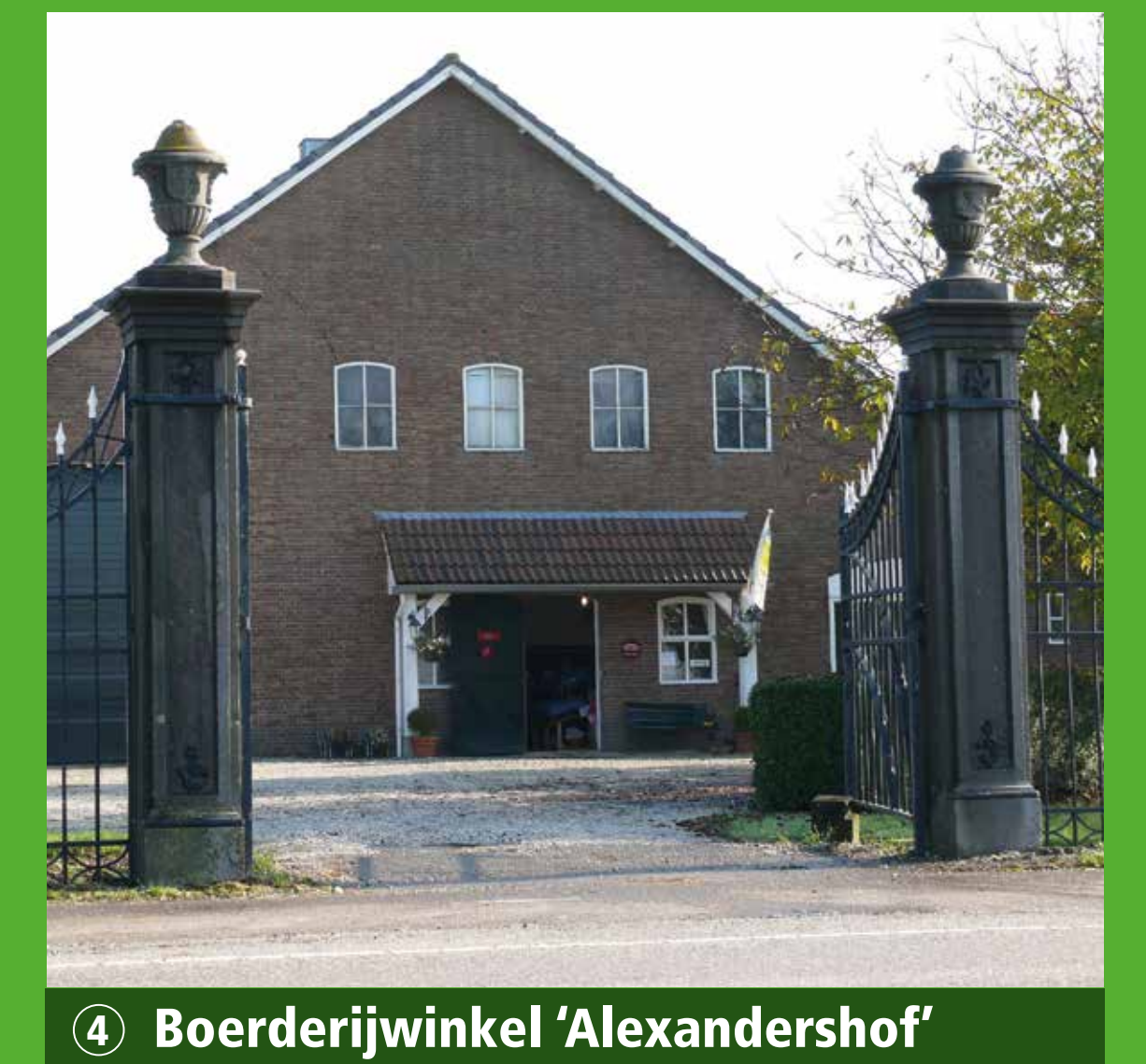
4 Boerderijwinkel 'Alexandershof'